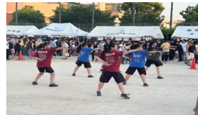
【ダンス(鶴見商業高等学校ダンス部)】