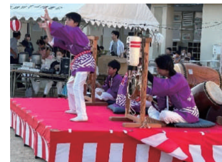
【だんじり囃子(鶴見地車保存会)】