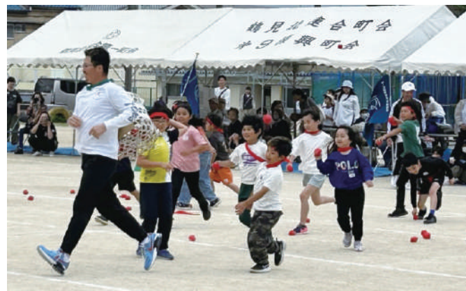
《子ども追いかけ玉入れ》